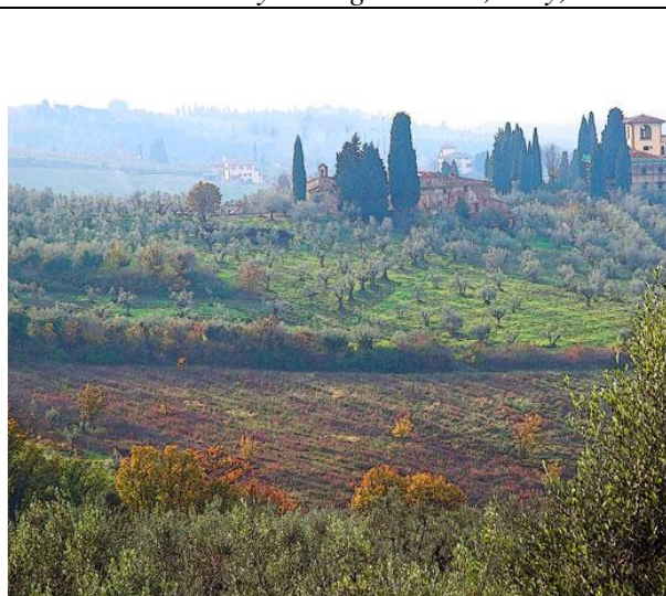
Scorci della campagna senese

(Hester Lynch Salusbury (1741-1821), Observations and Reflections Made in the Course of a Journey through France, Italy, and Germany )