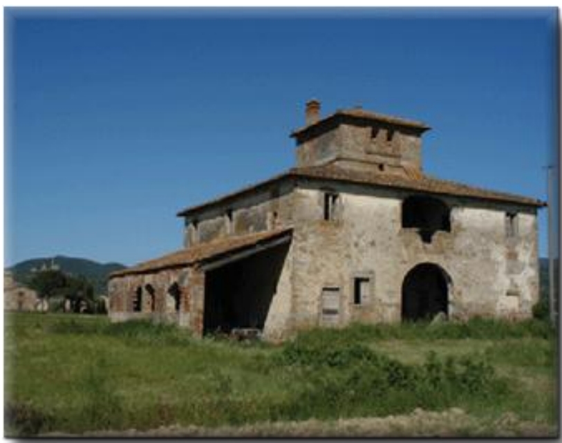
Tipica casa colonica senese coi segni dell'abbandono da parte dei mezzadri

Perché questa è la verità: quell'accordo tra borghesie cittadine e aristocrazia agraria che fu ordito, secondo i miei interlocutori di cui all'inizio, per sfruttare insieme i contadini (una visione forse frutto di un più che stagionato conformismo ideologico) non ci fu nel Medioevo, ma si è realizzato di fatto proprio oggi e sulle stesse terre. Ma, guarda caso, da una parte i neoborghesi della pseudo-sinistra al potere, quelli che sostanzialmente favorirono l'esodo dalla campagna e liberarono da uno scomodo occupante un patrimonio ambientale unico al mondo, e che sono quelli stessi che oggi, dai comuni che governano, rilasciano le concessioni edilizie, asfaltano le strade, danno pareri sui contributi regionali e comunitari, ecc. E dall'altra la neo-aristocrazia alloctona del vino, dell'olio e dell'agriturismo. Ai grandi ricevimenti cultural-mondani di quest'ultima, nei castelli e nelle grandi ville patrizie comprati a prezzi di liquidazione se non proprio per un pezzo di pane, i politici di sinistra locali sono sempre in prima fila, nei posti d'onore.