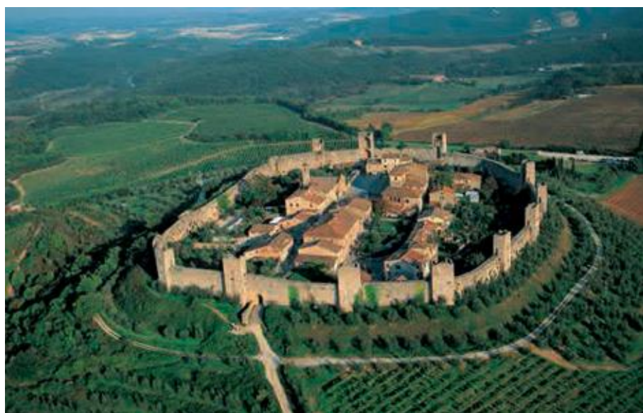
La terra nova Monteriggioni (Siena)

Un caso limite dell’attenzione dei cittadini verso il problema dei servi della gleba è rappresentato dalla cosiddetta Lex Paradisus del 1257 con la quale i Bolognesi si tassarono per riscattare le genti del contado dalla loro condizione di servi della nobiltà rurale. Ma tra gli strumenti più ingegnosi che i comuni adottarono allo stesso fine dobbiamo segnalare la costruzione delle “terre nove”.