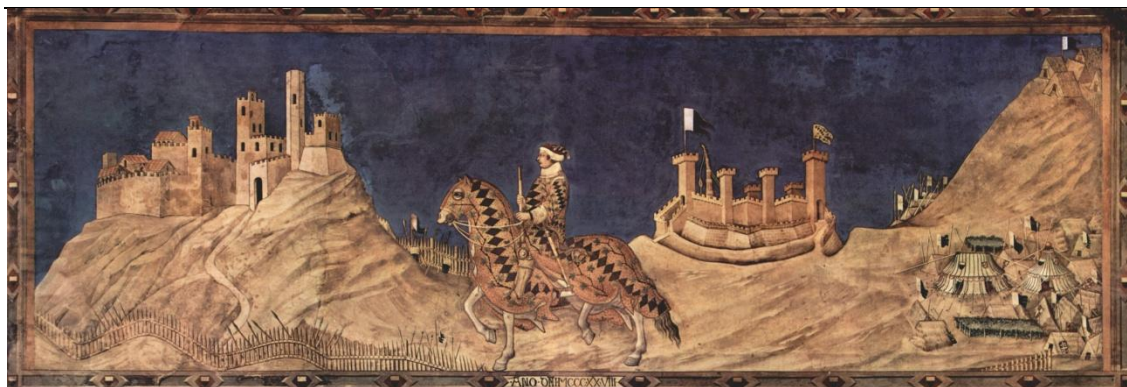
Simone Martini (1284-1344): Alcuni castelli sottratti ai conti Aldobrandeschi (Siena, Palazzo pubblico)

Il confronto coi conti Aldobrandeschi di cui si è detto, merita una nota. Non si trattò di cosa da poco, considerato che sottrarre territori a quei conti, grandi feudatari del papa, significava in sostanza sottrarre territori allo stesso Patrimonio di San Pietro: tant'è che un fondo speciale era stanziato nel bilancio del Comune per risarcire quei funzionari che fossero incorsi per quello o altri motivi, nella scomunica papale. Un'eco straordinariamente eloquente di quanto il confronto con quei conti (a Siena erano considerati, tra rispetto e odio, "i conti" per antonomasia) fosse vitale per la Repubblica lo vediamo nella grande Sala del Mappamondo in Palazzo Comunale dove tre delle quattro pareti furono destinate a raffigurare, per mano di Simone Martini, i castelli strappati soprattutto agli Aldobrandeschi (una sola parete affrescata è giunta sino a noi: quella contenente, oltre ai castelli di Montemassi, Piancastagnaio e forse Giuncarico, anche la figura equestre e assai nota quanto discussa del Guido Riccio da Fogliano).