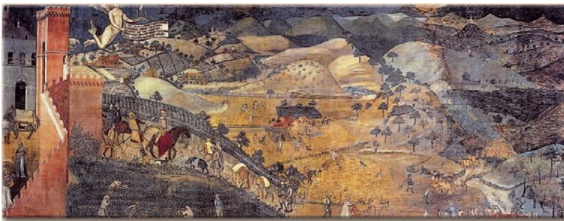
Ambrogio Lorenzetti (1290-1348): Gli effetti del buon Governo: la campagna (Siena, Palazzo pubblico)

dell'affresco, raffigurante la campagna, aleggia una leggiadra figura femminile, la Securitas , che tiene in mano, oltre a una forca da cui pende un brigante, il seguente cartiglio: Senza paura ogn'uom franco cammini / e lavorando semini ciascuno / mentre che tal comune / manterrà questa donna [la Giustizia] in signoria / ch'el ha levata a' rei ogni balia . Mentre sulla parete di fronte dedicata all' Allegoria del malgoverno (della tirannia, verosimilmente anche feudale), una figura terribile, Timor, armata di spada regge un cartiglio di ben altro significato: Per voler el ben proprio in questa terra / sommess'è la giustizia a tyrannia / unde per questa via / non passa alcun senza dubbio di morte / che for si robba e dentro da le porte .